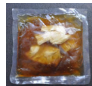
ゆばあんかけ丼の具 140g×5

こだわりの生ゆばをなめらかでコクのあるあんとして冷凍しました。優しい味わいがお口の中に広がります。温めておそばやご飯等にかけてお召し上がり下さい。